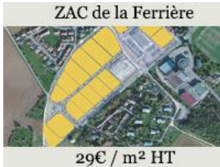
PLAN D'AMENAGEMENT DE LA ZAC DE LA FERRIERE A DIEULOUARD